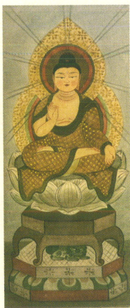
「穉月明・御照寺阿彌陀如来座像」伊賀市蔵