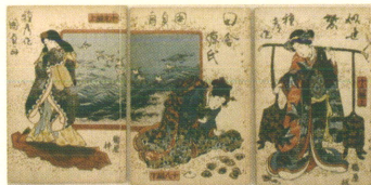
「歌川国貞・修紫田舎源氏」個人蔵