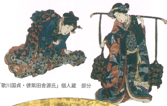
「歌川国貞・修紫田舎源氏」個人蔵 部分