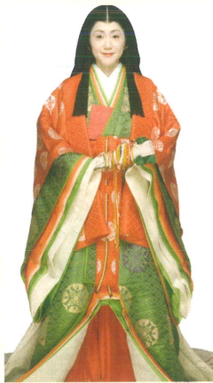
「十二単姿」協力：民族衣装文化普及協会