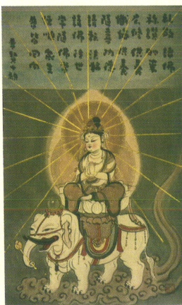
「穉月明・普賢菩薩」青山讃頌舎蔵