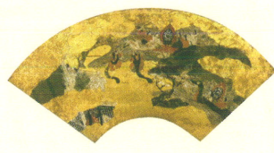
源氏物語扇面画 胡蝶／伊山文庫蔵