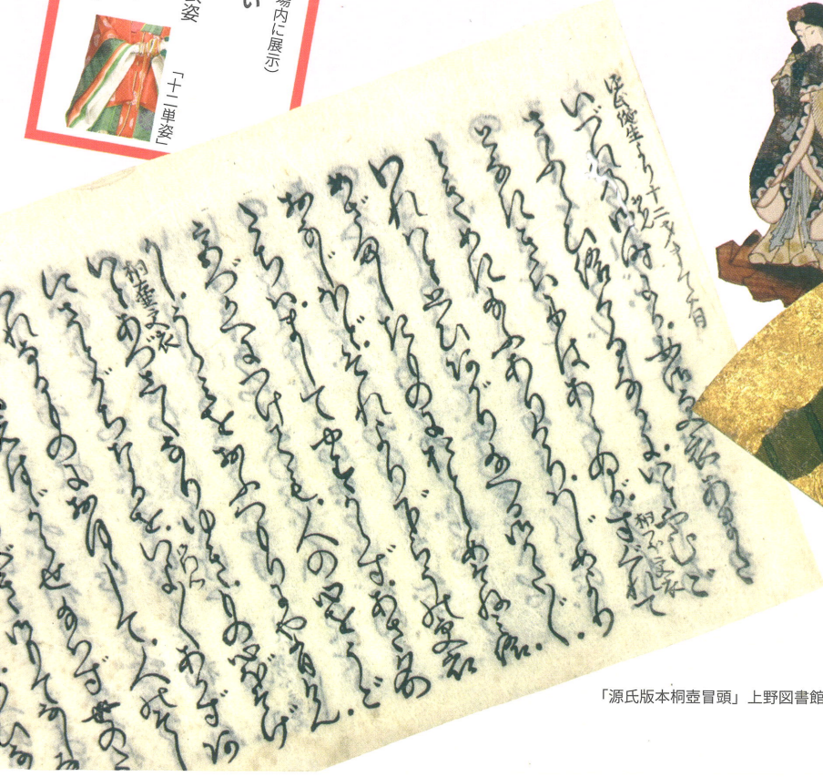
「源氏版本桐壺冒頭」上野図書館蔵