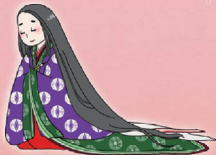
2024キャラクター 紫ちゃん