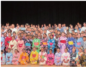
スポーツの祭典で