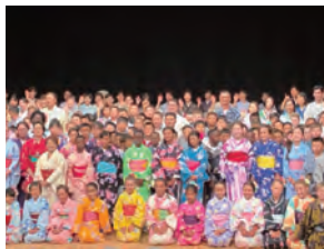
スポーツの祭典で