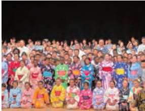
スポーツの祭典で