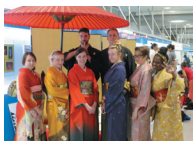
きもの体験in関西国際空港

2022年を迎えて更なる「きものでおもてなし」の普及・啓蒙を様々な業界の団体・個人と連携して推進しております。