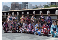
和心おもてなし体験