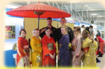
インバウンドの現場で