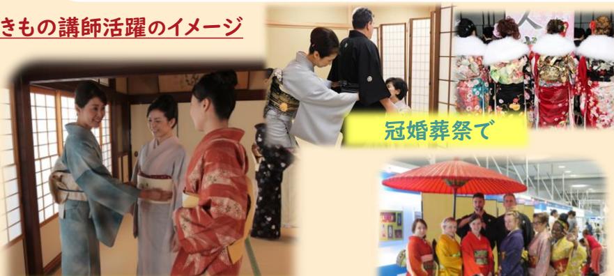
着付を教える先生として